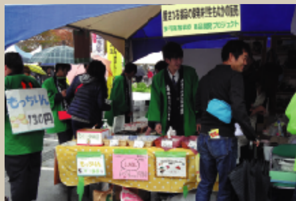
多可高校生達による産業展での販売の様子