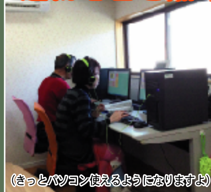
(きっとパソコン使えるようになりますよ)

「教室に来るのが楽しい」 「授業が分かりやすい」など お声をいただいております。