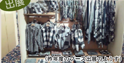
(昨年度のブース出展のようす)