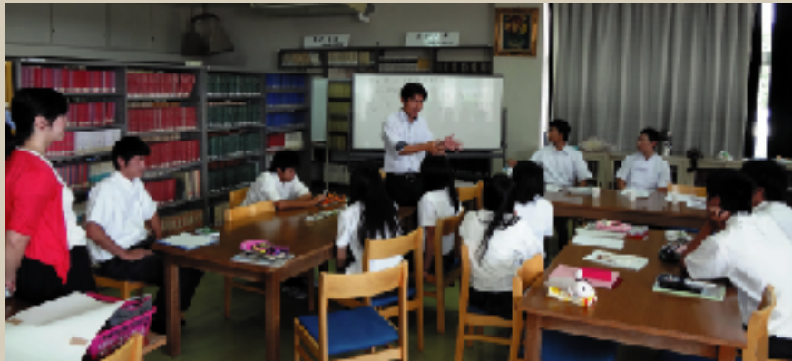
前年度授業の様子

昨年度の授業により「生もなか」というアイデアスイーツを生徒が考案し、今年度は商品化に向けたプロデュースの授業を9月から開始しています。