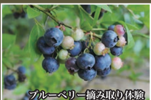
ブルーベリー摘み取り体験