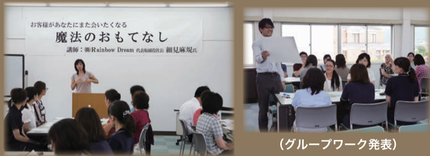
(グループワーク発表)

「おもてなしの必要性」「魔法のおもてなしはどうすれば良いのか」についてグループワークを行い、発表していただく中でお客様への気づかい、思いやりを持って接客することの大切さを学んでいただきました。