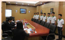
ベトナム人労働者 面接の様子

高度成長が続くベトナムは日本企業の関心の的であり、実際に多くの日系企業も進出している。ベトナムの現状とハイ市周辺の工業地帯の視察をはじめ、技能実習生の送出し状況、経済状況、日系企業の現状と課題など、今後の日本企業進出の可能性について情報交換を図った。