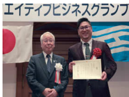
井戸知事と記念のツーショット

※地域経済循環創造事業補助金とは 地域の資源と地域の資金を活用し、事業を起し、地域の雇用を生み出し地域経済の活性化を図るモデルの構築を行う取組の初期投資に充当される交付金である。