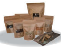
確かなドッグフード「TASHIKA」