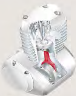
図. コンロッド (汎用エンジン使用例)