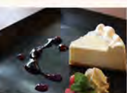
山田錦の酒粕レアチーズケーキ エーデルささゆり

多可町にふさわしい「新しいスイーツを！」と、一昨年に引き続き続いてレシピ募集した『第2回多可スイーツコンテスト』。最優秀賞に輝いた「大人のレア山田錦の酒粕ケーキ」は町内2店舗でメニュー化されており、他の店舗でも開発が続いています。