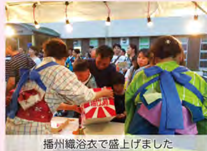
播州織浴衣で盛上げました

久々の播州織浴衣姿も艶やかに、多可の夏の風物詩にすっかり定着した様子でした。特賞の自転車を受賞された皆様、おめでとございました。