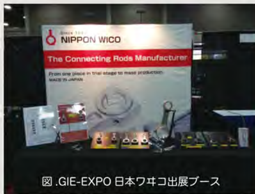
図. GIE-EXPO 日本ワキコ出展ブース

米国市場でのアルミコンロッドメーカーの認知度を上げるため、リアルとネットの両方で取組みを行いました。リアルでは、前記の GIE EXPO に出展。展示品についても、単なるアルミコンロッドではなく、顧客の課題解決につながるVA提案を展示することで興味を持ってもらえるように心掛けました。