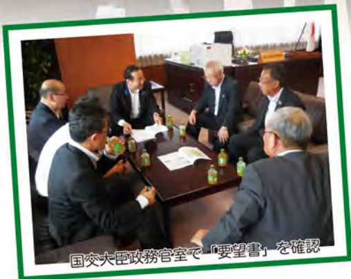
国交大臣政務官室で「要望書」を確認