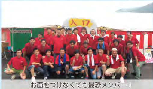
お面をつけなくても最恐メンバー！