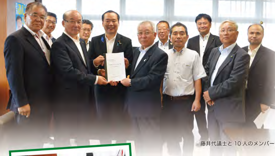
藤井代議士と10人のメンバー

7月24日(月)、商工会は町や町議会と「多可町に高速道路を誘致する会」を 結成して、多可町の道路整備の推進に関する要望書を国土交通省に届けてきた。