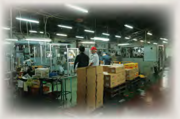
幾つものマシンと人により、次々と出来ていく製品

商工会は地域でしか解決できない課題（人材採用、地域企業とのビジネスでの連携など）に対する提案と具体的なアクションを期待しています。