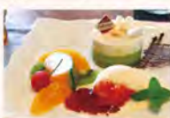
山田錦の酒粕スイーツ マ・ドンナ