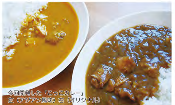
今回開発した「こっこカレー」 左（アジア風味）右（オリジナル）

小さな町ですが情報発信を続けることで、「播州百日どり」のファンが増え続け、多可町の産業と雇用の一躍を「播州百日どり」が担うようになり、そして、地域経済の発展につながりたいものです。