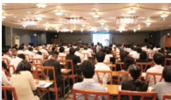
県内から192人の商工会職員が聞き入った。