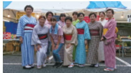
播州織の艶やかな浴衣姿で福引の対応