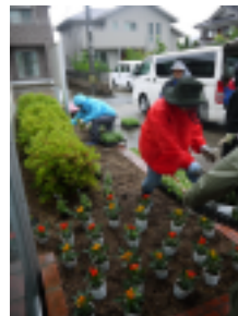
雨のお陰で水やりの手間がはぶけました。

雨にも負けず花壇植替えを執行。年間に2回程度、季節に合わせて商工会玄関前花壇の植替えを行っている。今回6月6日当日は雨の降る中、色とりどりの「ポーチュラカ」や「とうがらし」を雨にも負けずに植え替えを執行し、玄関前の花壇も華やかになった。