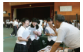
参加企業各ブースでの熱心な説明とそれに聞き入る生徒の皆さん