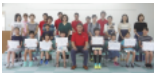
喜びの表情を浮かべる受賞した子供たち