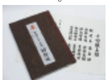
格調高い仕上がりの杉原紙納経帳

自分自身で漉いた杉原紙を製本したもので、紙漉き体験料込の価格は、なんと1冊79,800円!先日、体験購入された方からは「とても価値あるもの」とご満足いただいている。今年の体験日は10月15日を予定。