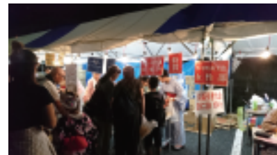
あいくの雨にも負けず大好評!

去る8月15日、ふるさとの夏まつり会場において、毎年好評の大福引大会を担当した。福引会場では、「当たり！」の鐘がなり響くたび歓声が聞かれ、花火が始まる頃には完売した。出鼻をくじかれるような雨で、人出が心配されたが多可町の住民はまつり好き。また、今年も播州織のゆかたを着て会場に華を添えた。