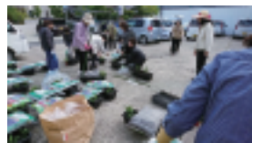
美味しいタカノツメを栽培しなくては・・・

女性部が合併して、10周年を迎える。今回、記念事業の一環として、タカノツメを全部員がプランターで各自栽培することになり、今後実ったタカノツメをリースやオイル漬けにして、女性部の事業で活用したいと考えている。どれだけ育つか収穫が楽しみ。