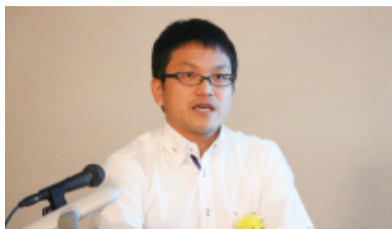
熱弁をふるう横畑主任