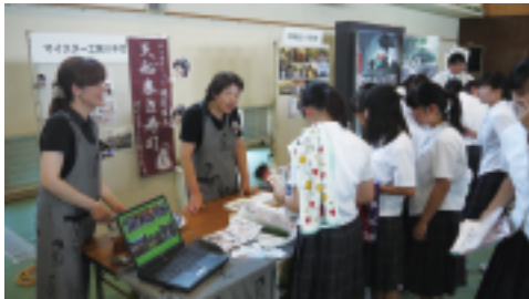
優しく分かりやすく事業内容を説明