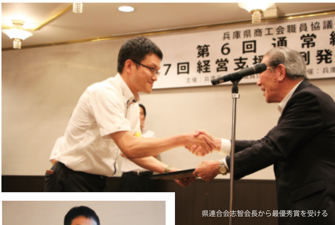
県連合会志智会長から最優秀賞を受ける